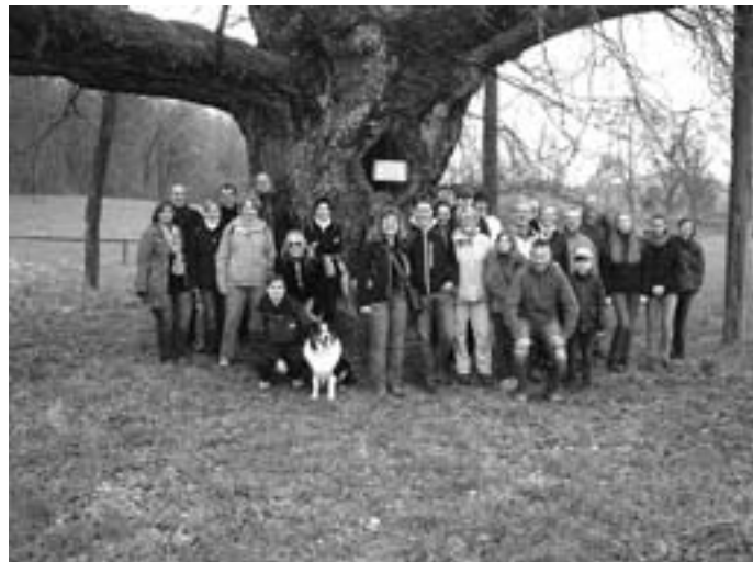
Die Lauftreff-Wanderer am Naturdenkmal Breiteich

Die Wanderer des Lauftreffs waren um 10 Uhr in voller Stärke an der Halle in Oberbrüden versammelt. Da sich auch der Disco-Club an gleicher Stelle zu einer Wanderung traf, gab es Gelegenheit zu einem kleinen Plausch mit den Lauftrefflern, die sich für die kürzere Wanderung bei der „Konkurrenz“ entschieden hatten. Mit fast 30 Zwei- und 2 Vierbeinern starteten wir pünktlich in Fahrgemeinschaften Richtung Schwäbisch Hall. Auf dem Weg stießen in Sulzbach noch weitere Teilnehmer zu uns und bald hatten wir unseren Ausgangspunkt, den Waldfriedhof von Schwäbisch Hall, erreicht. Um nicht zu früh beim Mittagessen anzukommen und den sportlichen Teil nicht zu vernachlässigen, ging es in einem weiten Bogen zunächst nach Süden über die B 14, vorbei an kleinen Seen und einer uralten knorrigen Eiche, dem Naturdenkmal Breiteich. Mehr als 10 Personen waren nötig, sie zu umfassen. Der Weg führte weiter durch den Wald zum Naturfreundehaus auf dem Lemberg. Das letzte Stück auf einem steilen Wanderweg, der wegen gefällter Bäume nicht ganz einfach zu begehen war. Das sorgte für etwas Schweiß, bevor wir mit dem richtigen Appetit unser Ziel erreichten.