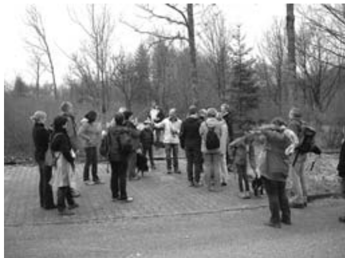
Kleine Pause unterwegs

Die Naturfreunde hatten alles vorbildlich organisiert, sodass wir bald unser vorbestelltes Mittagessen genießen konnten. Besonders die frischen Forellen haben sehr gut geschmeckt. Aber auch alle Nicht-Fischesser waren zufrieden und satt. Eine scharfe Einlage hatte sich der Chefkoch einfallen lassen, da er alle Teller mit klei-