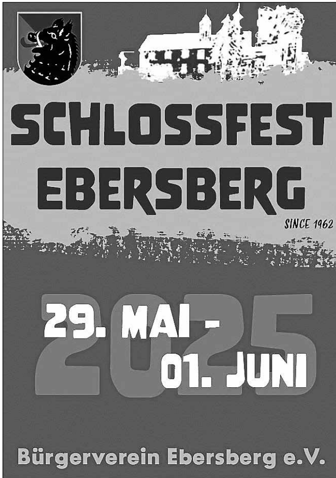
Plakat Schlossfest 2025

Es ist wieder so weit! Der Rast- und Spielplatz Ebersberg verwandelt sich Ende Mai in eine bunte Festoase für Jung und Alt. Der Bürgerverein Ebersberg e.V. lädt herzlich zum traditionellen Schlossfest ein – vier Tage voller Musik, Geselligkeit und Genuss warten auf Sie!