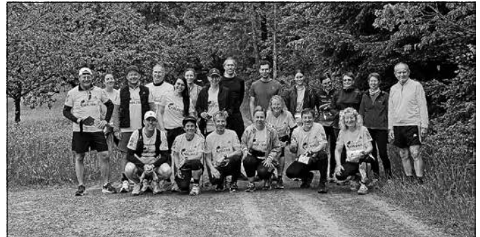
Das Team des LT Auenwald