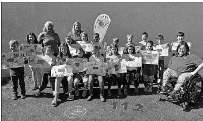
Bilder für das DRK-Preisausschreiben

Die Frauen haben uns auch noch etwas über das Rote Kreuz erzählt und was man machen kann, wenn jemand verletzt ist oder Hilfe braucht. Erstens: Mach keine Panik! Zweitens: Rufe 112 an! Drittens: Fragen beantworten und warten, bis Hilfe kommt. Wir haben auch Notfälle nachgespielt, z. B. dass sich unsere Lehrerin das Bein gebrochen hat und ohnmächtig war. Einer von uns hat dann die 112 angerufen und eine der Frauen war dann am anderen Ende und hat uns gefragt, was und wo es passiert ist und so weiter. Es ist toll zu wissen, dass dann Hilfe kommt!