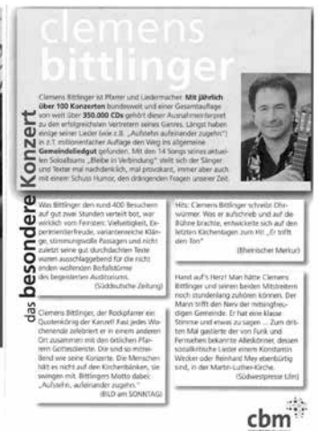
Grafik: CVJM und Kirchengemeinde